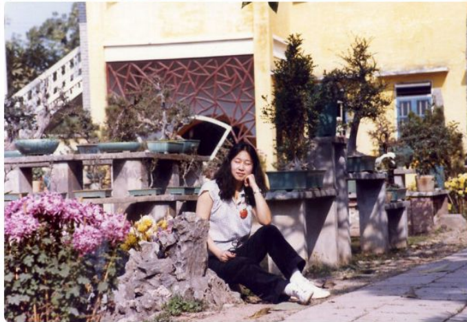
等到我斩眼时才影!