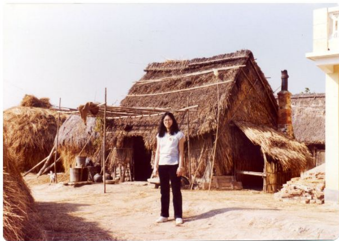
第一次见到茅屋, 觉得有趣 - 只是烈日当空, 晒到我冤口冤面!